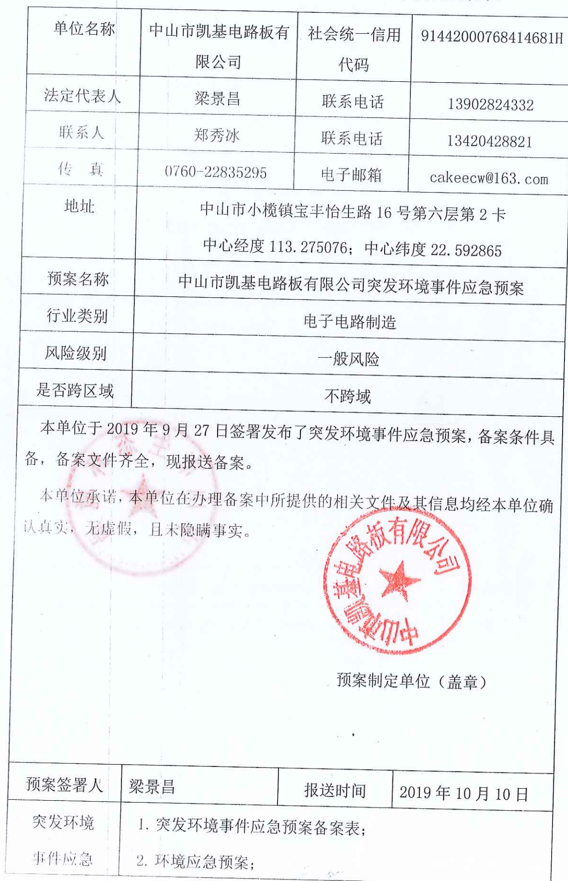
企业事业单位突发环境事件应急预案备案表